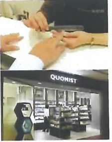
◎爪の形を整えて磨き上げる ◎店に向かって左側のエントランス。左手にあるのがクイックサロン

待つことが苦手な男性のために、サロンの料金体系は10分1000円に設定。商品売り場からサロン内が見渡せるようにして、入りやすい雰囲気をつくった。低料金で、予約なしでもさっと立ち寄れて短時間で終了するため、これまでネイルサロンやエステなどに二の足を踏んでいた層を引き付けた。