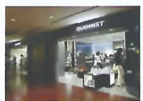
クオミスト ●所在地/東京都千代田区丸の内1-5-1新丸の内ビルディングB03-6269-0111 ●営業時間/11時~21時(日曜・祝日は20時) ●不定休 ●売り場面積/84㎡ ●取扱商品/化粧品、雑貨など このほか上野に2号店がある