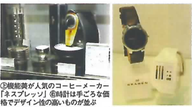
◎機能美が人気のコーヒーメーカー「ネスプレッソ」 ◎時計は手ごろな価格でデザイン性の高いものが並び

来店客は、店の右側のエントランスから店内へ。すぐ右手には飛行機模型やミニカーなどを陳列し、あたかも雑貨店と思わせて引き込む。名刺入れや小銭入れなどの革小物、その隣は消臭下着、その向かいには文具が並び、さらにはインテリア家電と、変化に富んだ並びで客足を店の奥へと誘う。