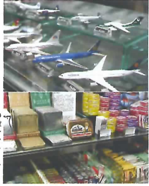
◎独ヘル社の飛行機模型上段左はミントタブレット「ヒントミント」。尻ポケットに入れやすいようケースがカーブしている