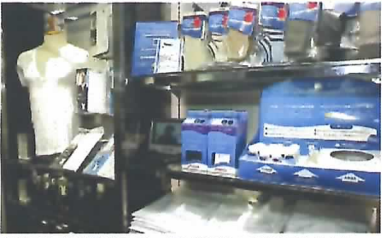
消臭下着。Vが深くワイシャツの第2ボタンを開けても見えない

男性の美容関連市場が成長分野として注目を集めている。しかし、美容に興味があっても、いざ実践となると、気が引けるのが実情だ。そんなおしゃれ予備軍ともいえる男性の心を捉えて、話題になっている店がある。今年4月、東京駅前に開業した新丸の内ビルディング内にある男性向け化粧雑貨専門店クオミストは、ブラザスタイル(旧ソニーブランド)が手がけた初の男性向け兼売、売上高は予想の10%で推移中。男をオシャレに引き込むカラクリを探ろうと、業界関係者の視察が絶えない。