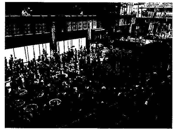
日常のハレで来館者を増やす街のリビングルーム 二子玉川ライズ

果だったのは大屋根のパブリックスペースでの年間300を超えるイベント開催である。冬季のスケートリンク、夏のビアガーデン、大茶会、スラックライン、地域の神輿会、盆踊り、運動会、現代アートなど日常のハレのイベントにより、人と人、人とモノ、人と情報、そして人と地域がつながるギャザリングの楽しさを生み、ふらりと頻繁に訪れたくなる縁日、縁側、縁台の雰囲気をつくった。まさに日常のハレのライフスタイルを創造したことで来館頻度を高めた成功事例だ。