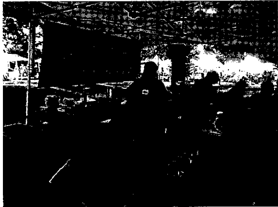
ポートランドのファーマーズマーケットで行われる子どもの料理教室

SCの日常のハレとは、ただ必要なモノを満たす日常べつたりの場ではなく、そこに楽しみや心地よさが加わった発見や体験がある